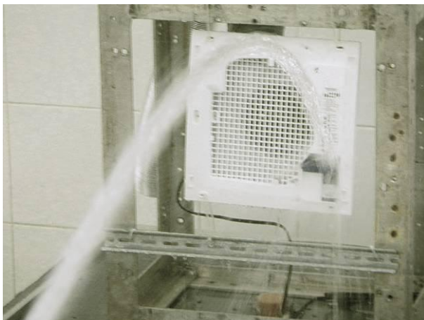
Bild 3 Prüfling Nr.1 im Prüfgestell positioniert mit genormtem Strahlwasser an der Funktionsplatte nach der Strahlwasserschutzprüfung IPX5