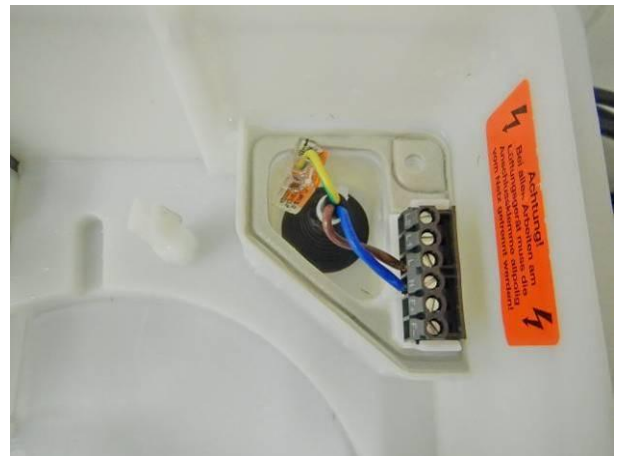
Bild 10 Prüfling Nr.2 (Teilgehäuse geöffnet) keine Wasserspuren im Anschlussbereich nach der Strahlwasserschutzprüfung IPX5