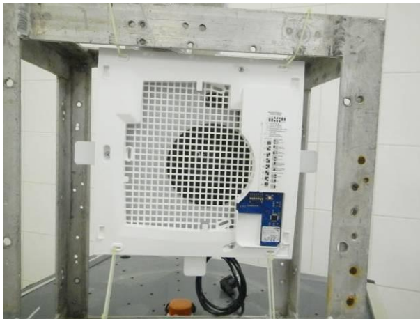
Bild 7 Prüfling Nr.2 ohne Frontabdeckung im Prüfgestell positioniert vor der Strahlwasserschutzprüfung IPX5