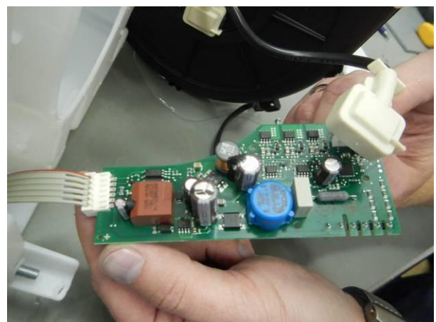
Bild 6 Prüfling Nr.1 (Steuerplatte) keine erkennbaren Wasserspuren auf der Steuerplatte nach der Strahlwasserschutzprüfung IPX5