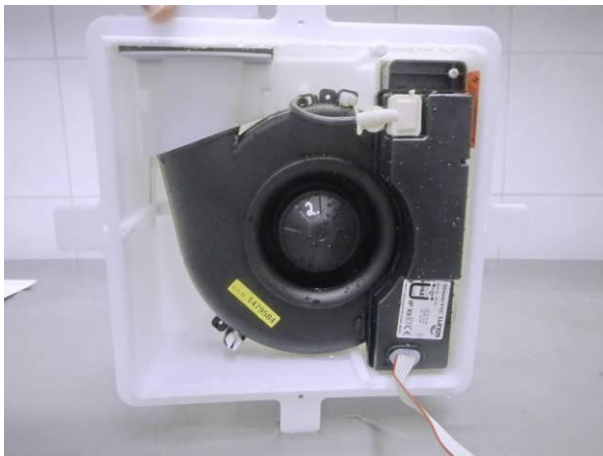
Bild 9 Prüfling Nr.2 (geöffnet) erkennbare Wasserspuren im Innern nach der Strahlwasserschutzprüfung IPX5