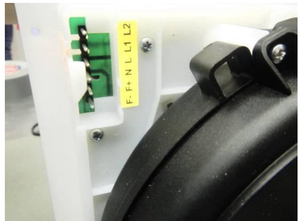
Bild 4 Prüfling Nr.1 (geöffnet) keine erkennbaren Wasserspuren am Leitungsanschluss nach der Strahlwasserschutzprüfung IPX5