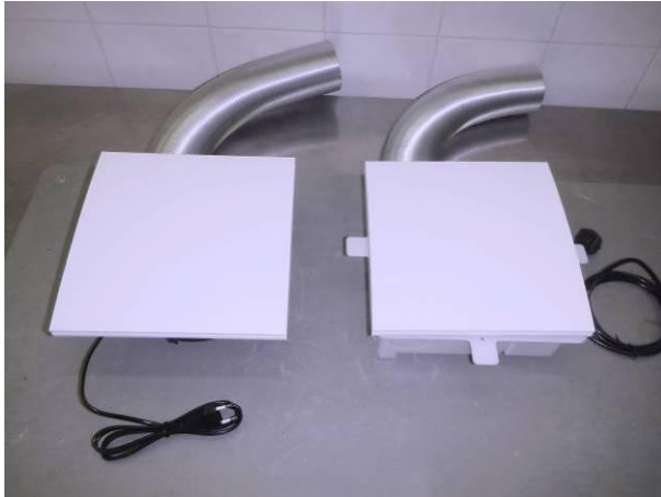
Bild 1 Prüflinge Nr.1+2 im Anlieferungszustand vor den Strahlwasserbeanspruchungen