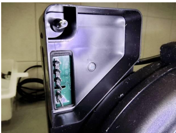
Bild 11 Prüfling Nr.2 (Teilgehäuse geöffnet) keine Wasserspuren im Anschlussbereich nach der Strahlwasserschutzprüfung IPX5