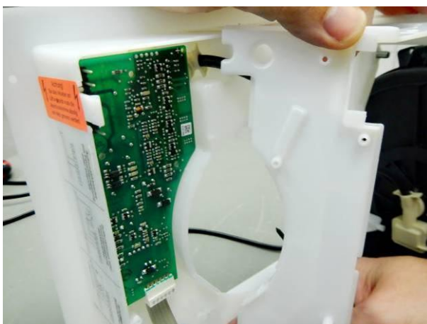
Bild 5 Prüfling Nr.1 (geöffnet) keine erkennbaren Wasserspuren im Teilgehäuse mit Steuerplatte nach der Strahlwasserschutzprüfung IPX5