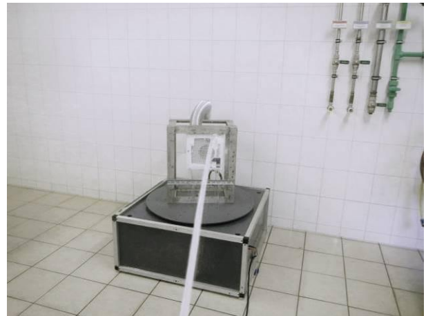
Bild 8 Prüfling Nr.2 mit genormtem Wasserstrahl am Frontbereich bei der Strahlwasserschutzprüfung IPX5