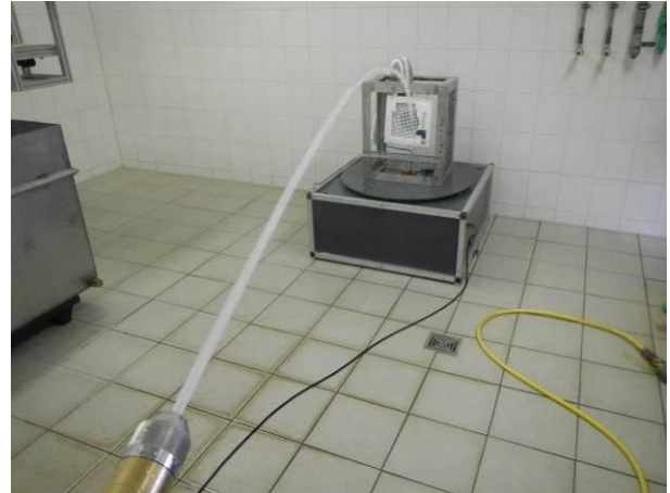
Bild 2 Prüfling Nr.1 im Prüfgestell positioniert mit genormtem Strahlwasser am Frontbereich bei der Strahlwasserschutzprüfung IPX5